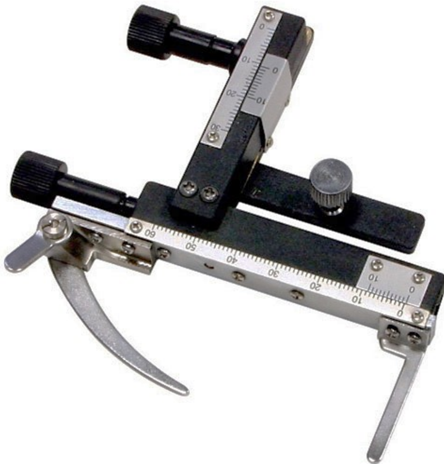
Rysunek 1. Nasadka krzyżowa do stolika mikroskopowego

Po wykonaniu zadania uporządkuj stanowisko pracy.